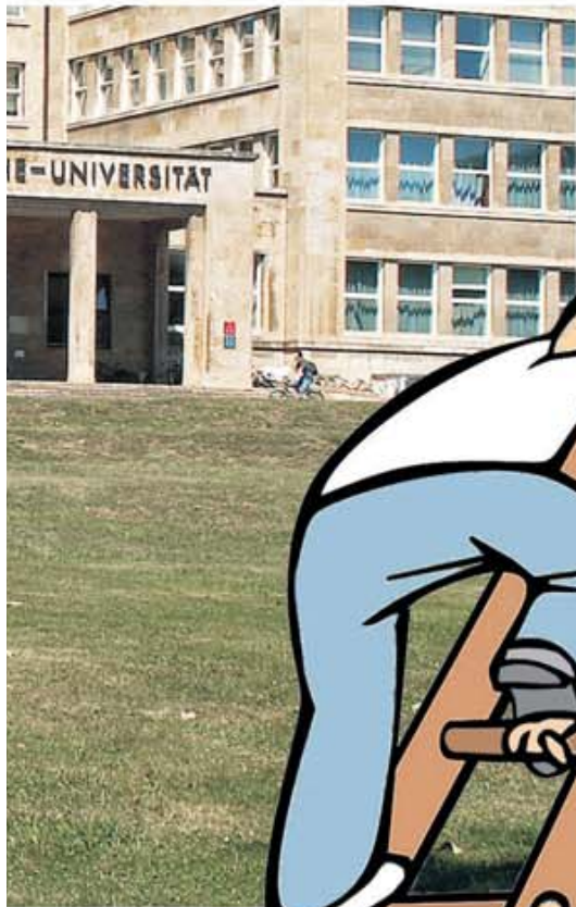
ort, weil sie „zu afik: h1-daxl.de

en für Wirtschaftsstudenten so s als die Generation vor ihnen